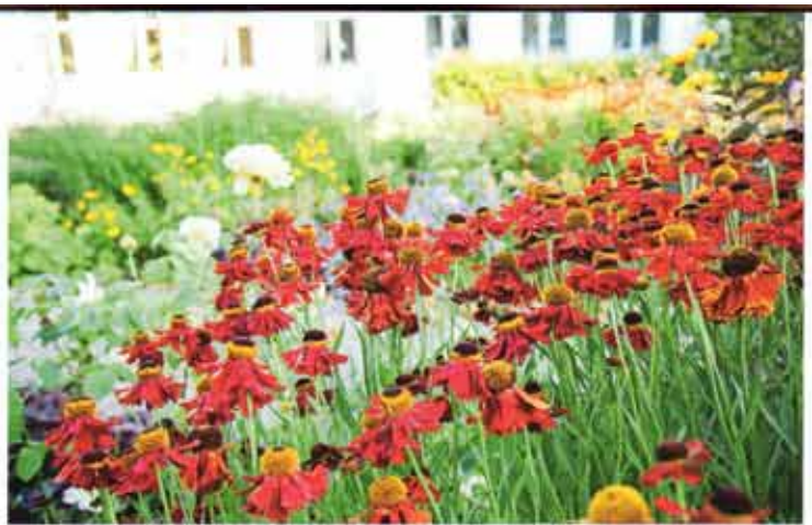
Trädgårdssolbrud, 'Moerheim Beaut' lyser upp hela trädgården.