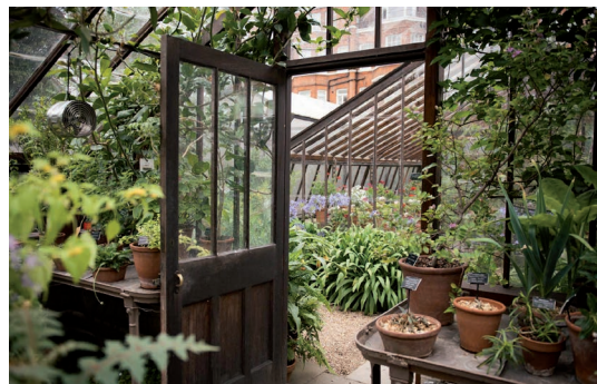
Vackra gamla växthus i Chelsea Physic Garden