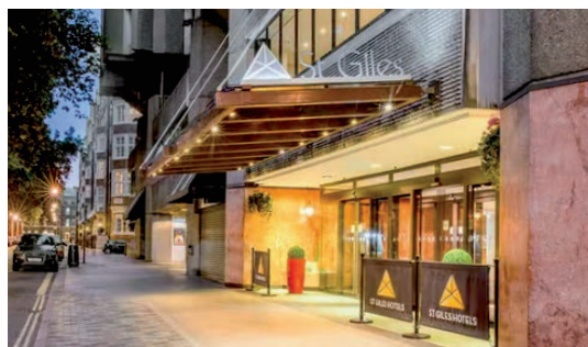
Vårt hotell ligger i centrala London

Lunch intas på egen hand i något av caféerna på Kew. Här finns också en shop med ett stort urval trädgårdsrelaterade böcker och prylar. Framåt eftermiddagen åker vi tillbaka till hotellet. De som vill får resten av eftermiddagen och kvällen "ledigt" och de som vill följer med Anette till en trevlig restaurang i närområdet.