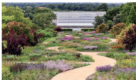
RHS Wisley, en stor visningsträdgård och park