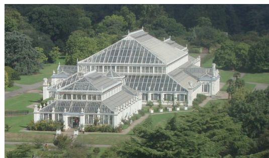
Glashusen i Kew rymmer mängder av exoter