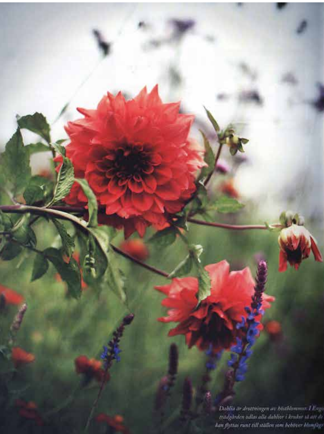
Dubbla är drottningen av höstblommor. I Englands trädgårdar odlas alla dubblor i krukor så att de lätt kan flyttas runt till ställen som behövs blomfärdigt.