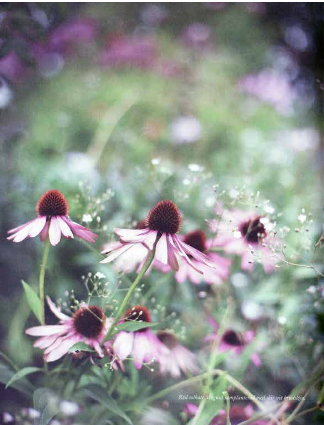
Röd solhatt, Magnus Samplantereri med skär vit brudblöja.

ner förrän till våren. Men den som känner för att aktivera sig utomhus en solig höstdag behöver inte vara sysslolös.