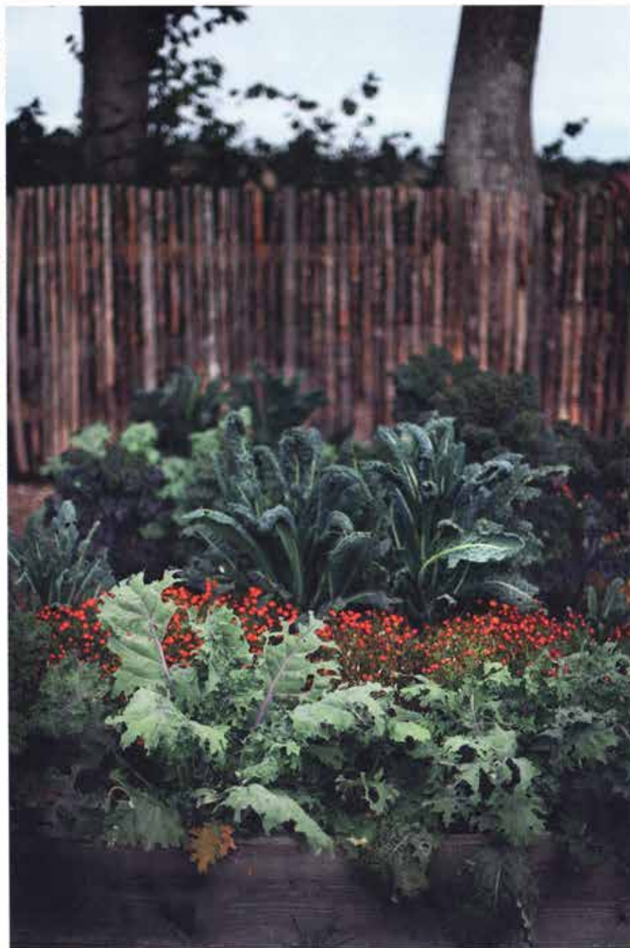
I köksträdgården varvas kålplantorna med den låga kryddtagetesen, vilket hjälper till att förvälla kålfjärten.

Elda inte upp löv och trädgårdsavfall utan ge tillbaka till jorden som gödning och strukturförbättring.