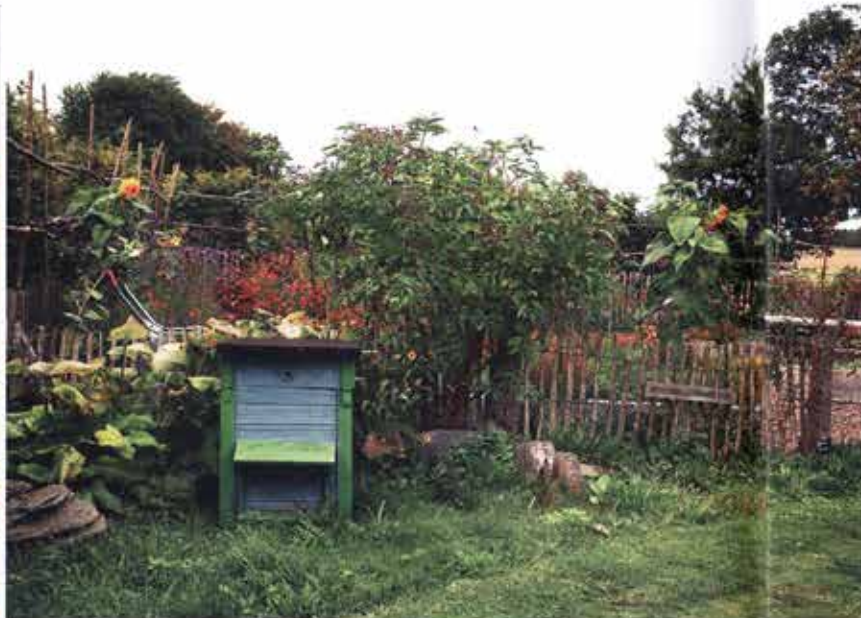
t.v. Varma färger i perennrabatten med dagöga Summer Nights, Linnétagetes och den blåfila nävnan Rozanne i* bela bösten. t.h. Bakom den gamla bikupan skymtar köksträdgården med den höga solle Sun King.