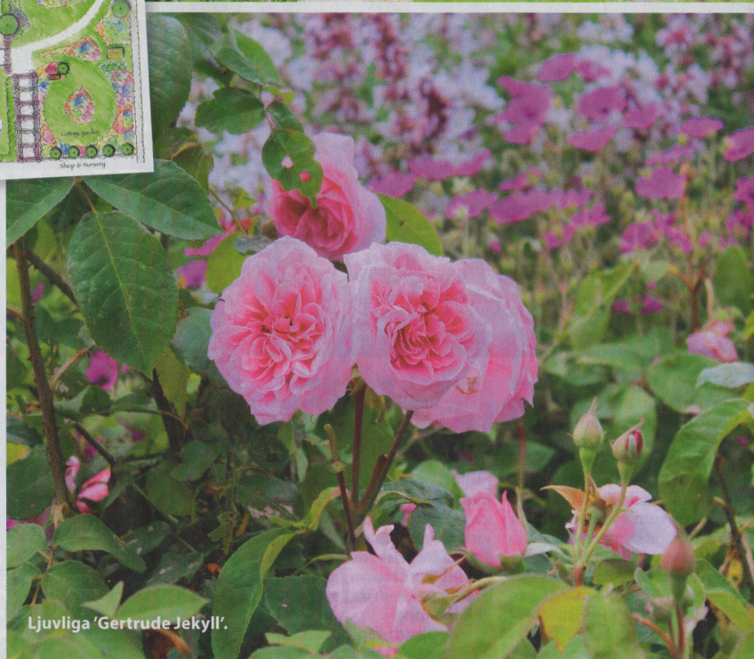
Ljuvliga 'Gertrude Jekyll'.

Hemsida: www.denengelska-tradgarden.se . Här kan du också läsa mer om de guidade rosenvandringar som bokas i förväg.