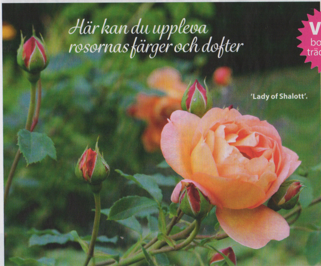
'Lady of Shalott'.

Här kan du uppleva rosornas färger och dofter