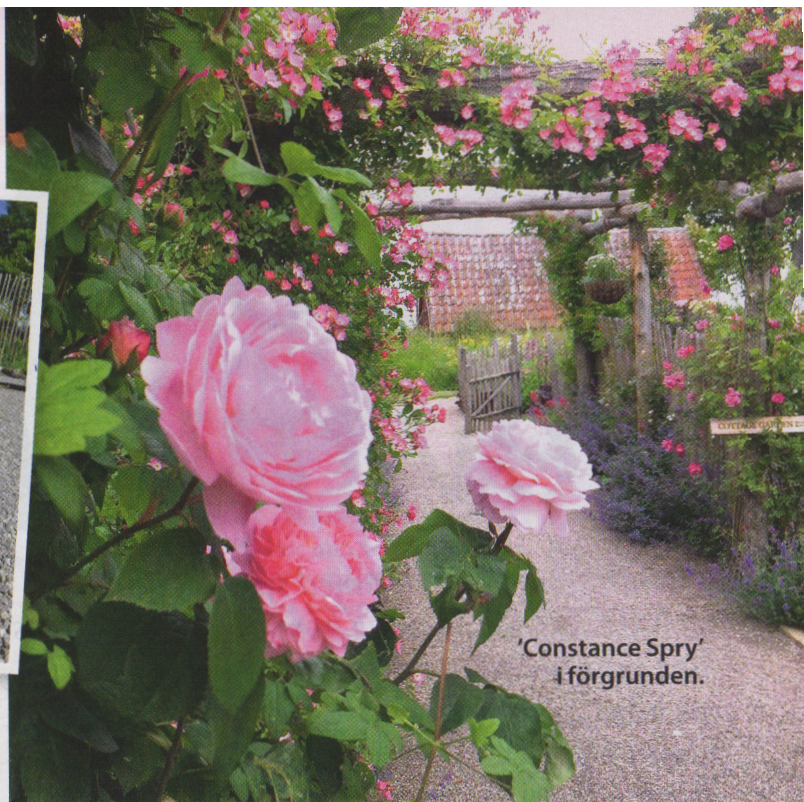
'Constance Spry' i förgrunden.